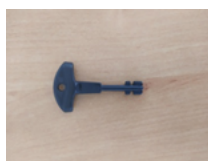
Chave do Botão de Emergência